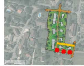
Schéma illustratif sans valeur réglementaire

La densité moyenne des nouvelles opérations de développement résidentiel (faisant l'objet d'une OAP) est de 24 logements à l'hectare, ce qui est compatible avec la prescription du SCoT (25 logements par hectare).