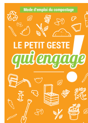
1 mode d'emploi